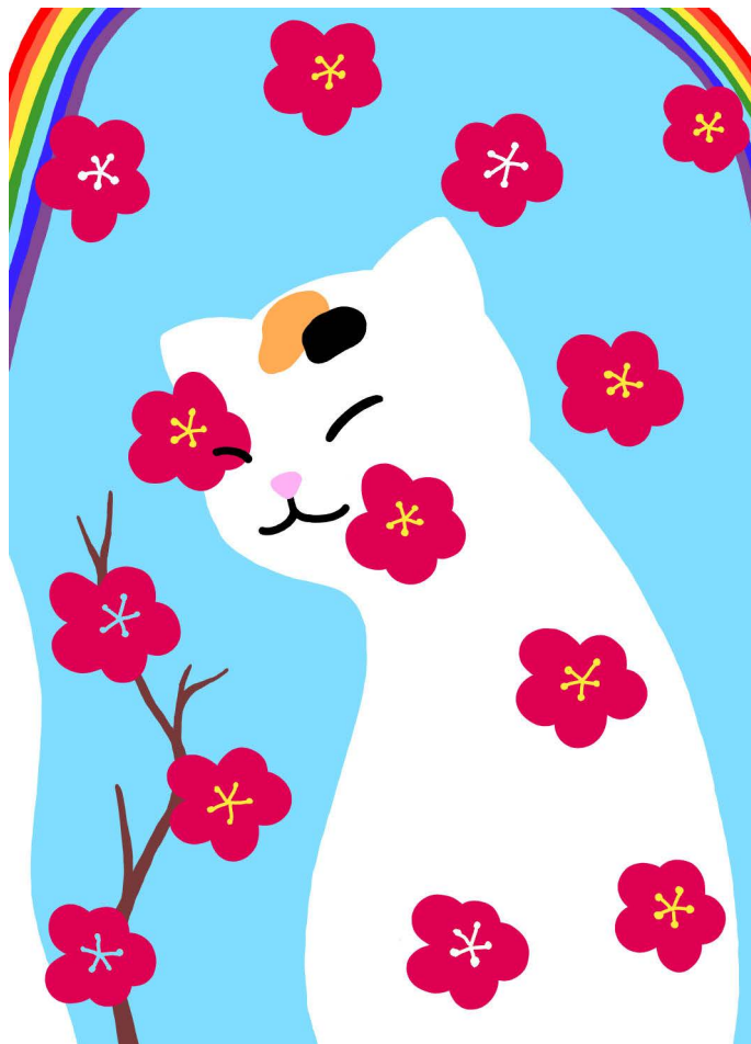
illustration by Yuhei Yamada